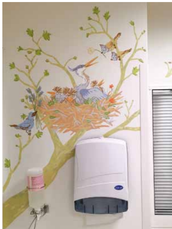
Ci-dessus : détail de la chambre n° 1308