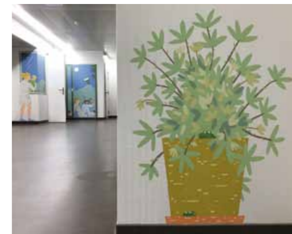
Ci-contre et ci-dessus : vues du couloir